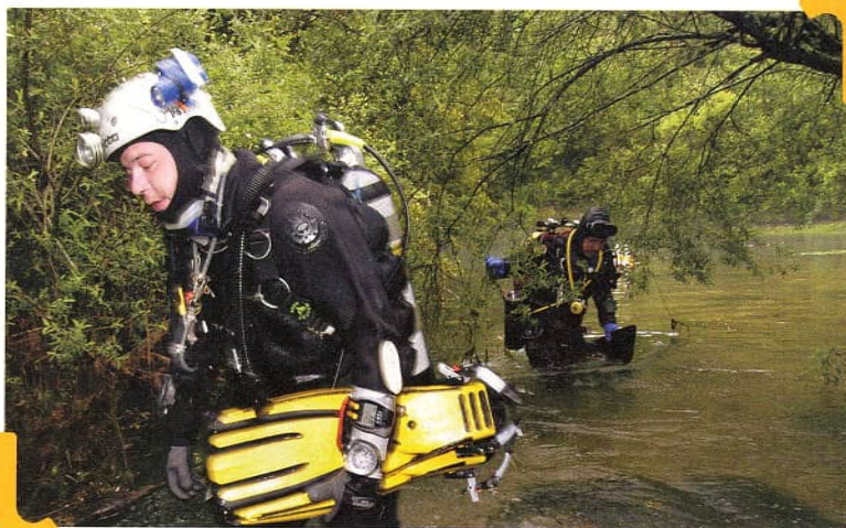
Quelques règles simples s'imposent afin de mieux prévenir les risques potentiels de la plongée spéléo.

rents sont rapprochés et n'imposent donc pas de faire des dizaines de kilomètres en voiture pour transporter les hommes et le matériel. Il semblerait que l'on s'oriente dans le département vers une législation qui me paraît intelligente en matière d'utilisation des gouffres. Oui, il faut quelques règles mais point trop. Prévenir les pompiers ou les gendarmes avant de descendre me semble utile sans être trop pesant.