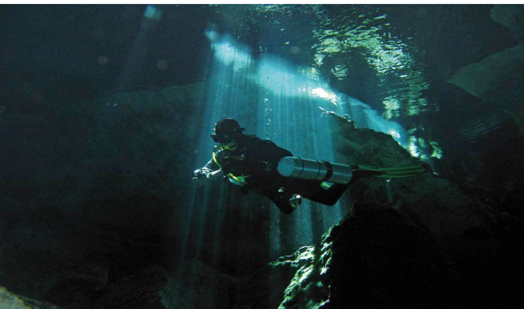
... The Pit (Einstiegstopf) an der Riviera Maya (Quintana Roo, Mx)

Man lernt, seriös, methodisch und präzise zu arbeiten, zu kontrollieren und Verant-