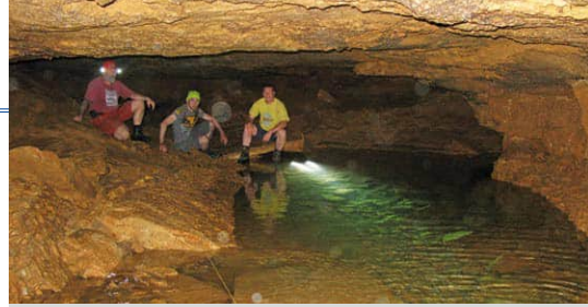
Trou Madame (Lot / F) im Eingangsbereich bei Tiefstwasserstand.