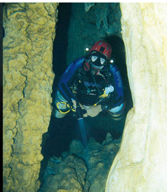
In einem Canyon / irgendeiner cenote in der Gegend von Tulum (Mx)