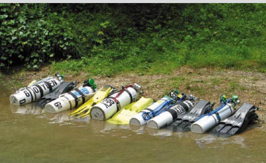
Mit einer guten, soliden und halt nicht gerade billigen Ausbildung, einem adäquaten Equipment und der pingeligen Einhaltung von Sicherheitsregeln ist Höhlentauchen ein faszinierende, naturbezogene und auch persönlichkeitsbildende sowie mit handhabbaren Risiken behaftete Aktivität, welche einem unvergessliche Erlebnisse beschert und immer wieder aufs Neue begeistert!

wortung zu übernehmen. Und man ist gezwungen, auftretende Probleme SOFORT und VOR ORT zu lösen – und meist sogar noch selbst. Man kann nichts auf die lange Bank schieben, man muss unter Druck Entscheidungen treffen mit allen Konsequenzen. Man muss auch gewisse Führungsqualitäten mitbringen. Mir jedenfalls hat das in meiner beruflichen und ausserberuflichen Karriere sehr geholfen. Diese Fähigkeiten lassen sich in guten Kursen explizit fördern und weiterentwickeln. Kurse, welche sich nur auf gutes Equipment oder auf rein technische Skills beschränken, gehen am Kern der Sache vorbei.