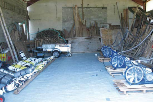
Auch eine entsprechende Fülllogistik gehört dazu – Füllstation SCD in Rocamadour.